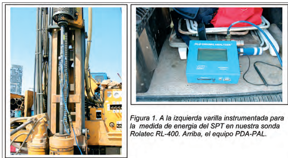
Figura 1. A la izquierda varilla instrumentada para la medida de energía del SPT en nuestra sonda Rolatec RL-400. Arriba, el equipo PDA-PAL.

Conociendo además el módulo de Young de la varilla instrumentada y su sección transversal, el equipo PDA permite conocer la energía real transmitida por los equipos automáticos de golpeo de las sondas (Fig. 2).